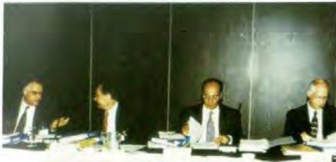
WWC Büro Toplantısı, (İstanbul, 2001)

10. Governörler Kurulu toplantısı nedeniyle İstanbul'da bulunan WWC yöneticileri 22 Mart 2001 günü