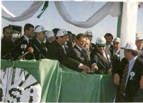
Birecik Barajı ve HES törenle devreye girdi.

The Birecik AŞ comprises Turkish, Austrian, Belgian and French firms. Two units of the Dam and HPP started to generate energy on 2 December 2000 with a ceremony attended by Deputy Prime