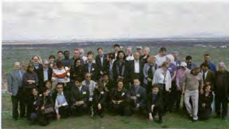
WWC Güvernörleri Harran'da

Turkey has embarked on an ambitious water development program to meet the needs of its population and the environmental sustainability. "Turkey is proud and happy to host the 10 th Meeting of the Board of Governors of the World Water Council.