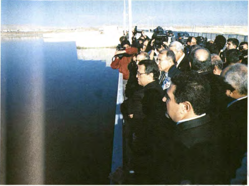
Birecik Barajı ve HES törenle devreye girdi.

Energy production started with the ceremony