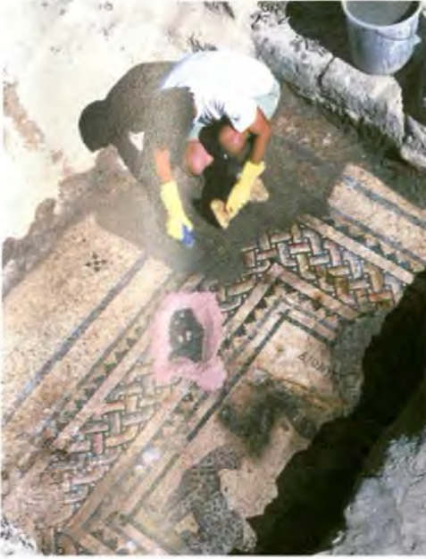
Zeugma'da kurtarma çalışmaları