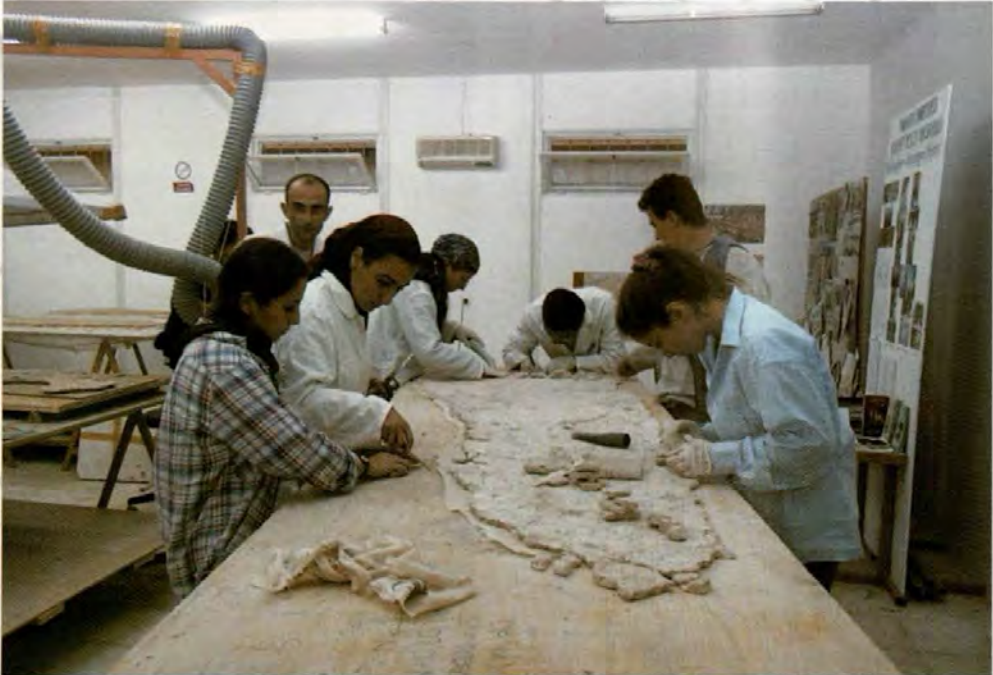
Gaziantep Müzesi'nde laboratuvar çalışmaları

A team composed of Italian and Turkish specialists undertook the task of conservation and restoration