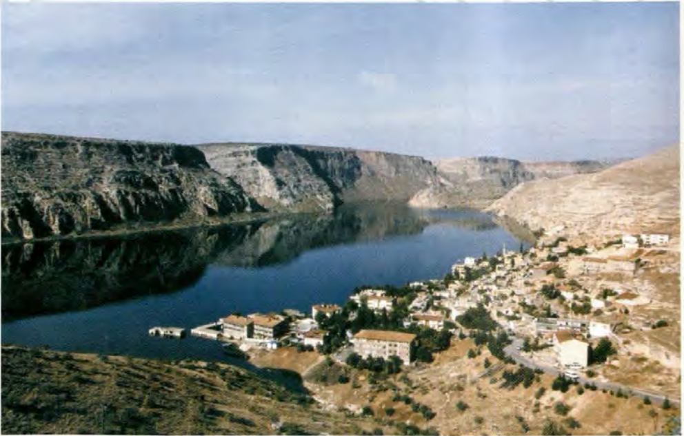
Baraj suları yükseldikten sonra Halfeti...

T he project was given start in September 1997 and since then various activities were carried out in regard to the spatial, social and economic components of the project. In this process a "first" was realized in Turkey through cooperation and coordination with relevant governmental organizations. That means the resettlement of people whose dwellings were affected by the dam lake in the same