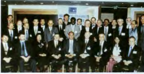
WWC Governörleri İstanbul Toplantısı Meeting of the WWC Board of Governors, Istanbul

DSI Genel Müdürlüğü tarafından Ankara'da düzenlenen kutlamalara katılmışlar ve bu olay dolayısıyla yapılan resim yarışmalarına katılan öğrencilerin resimlerinden oluşan sergiyi de gezmişlerdir.