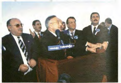
Energy production started with the ceremony