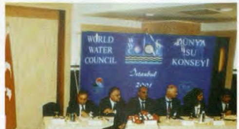
İstanbul'daki WWC Güvernörler Heyeti toplantısı dolayısıyla düzenlenen basın toplantısı