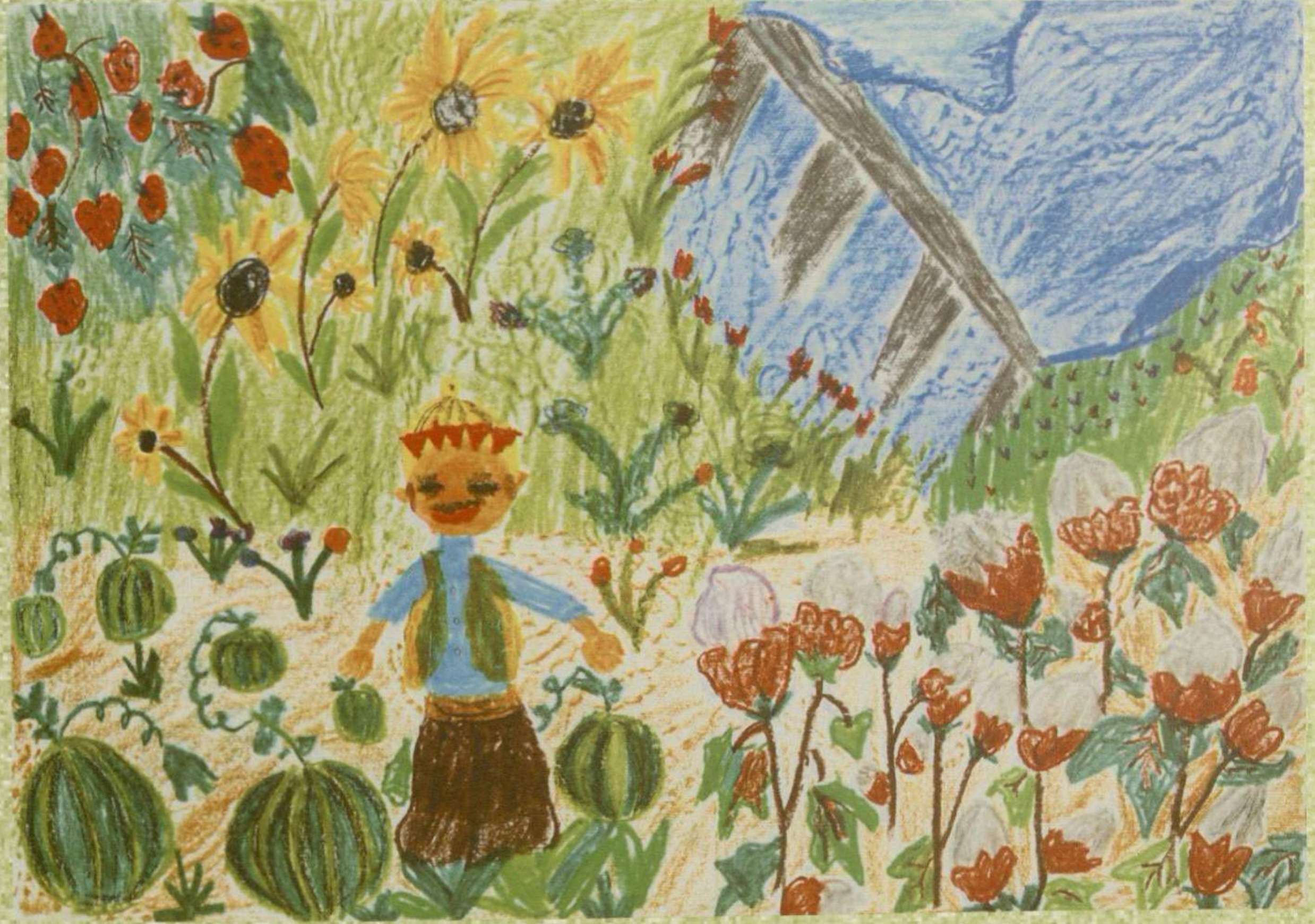
ALPER DEMİRKOL ÖZEL AMİD İLKÖĞRETİM OKULU / DİYARBAKIR