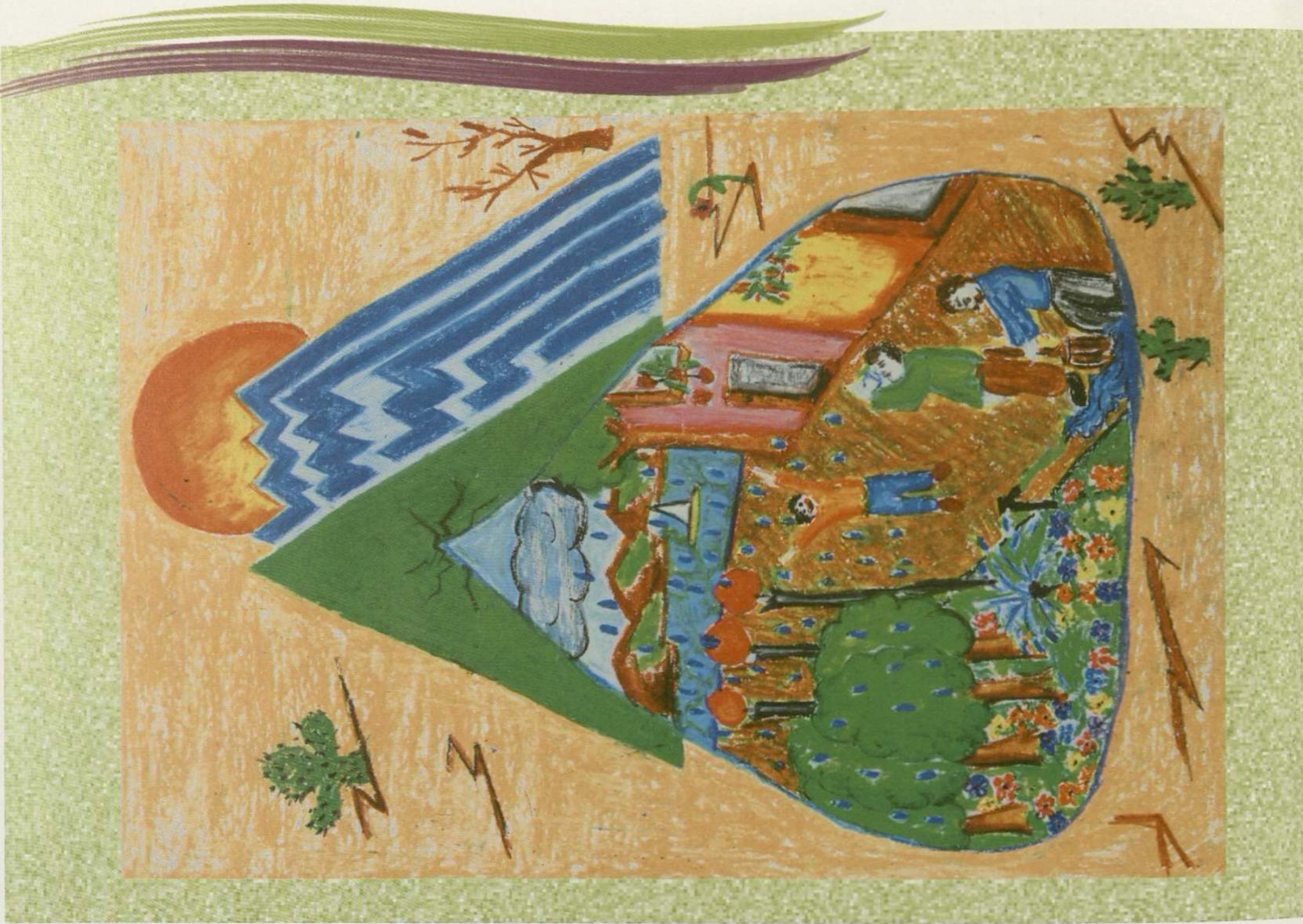
SUEDA SALMANER YENİŞEHİR İLKÖĞRETİM OKULU / ŞANLIURFA