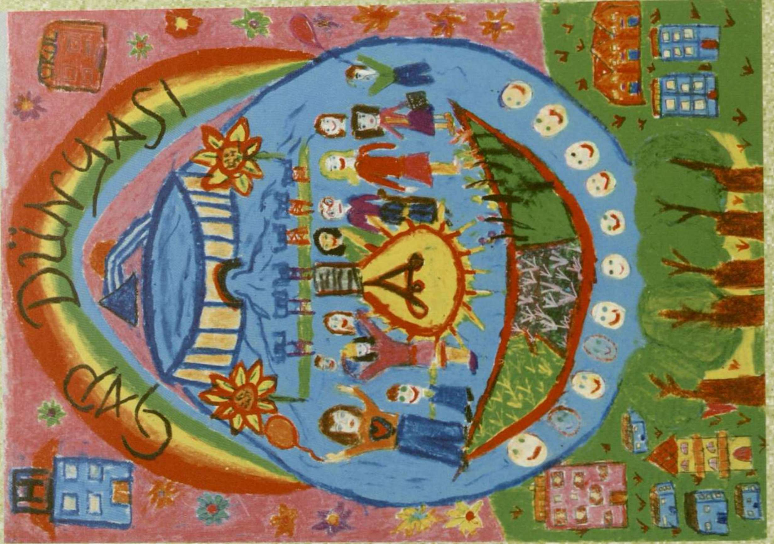
KÜBRA YILMAZ FATİH İLKÖĞRETİM OKULU / BATMAN