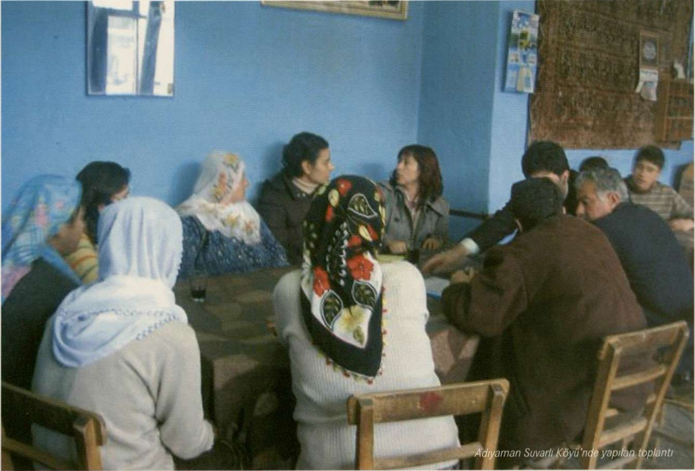
Adıyaman Suvarlı Köyü'nde yapılan toplantı

de bu ürünleri alırken, üreticilerin kültürleri hakkında bilgi sahibi olurlar. Bu durum hem kültürel miras hakkında bilinçlenmeye ve kültürel mirasın korunmasına, hem de ürünün karşılığının doğrudan üreticiye gitmesine katkıda bulunur.