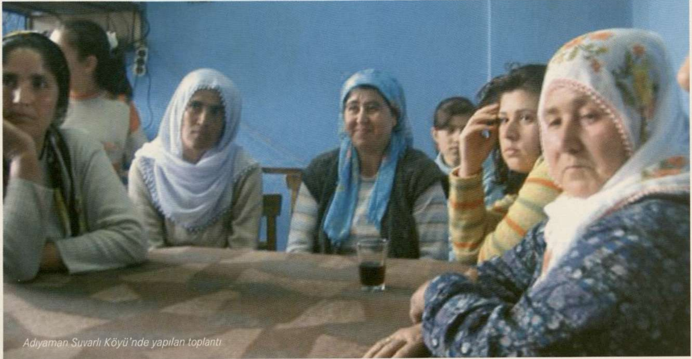
Adıyaman Suvarlı Köyü'nde yapılan toplantı

Suvarlı Köyü'nde bu ticaretin gerçekleşmesi için kooperatif kurulma çalışmalarına başlanmıştır. Kooperatif çiftçilerin eşlerinden kurulacaktır. Kooperatif çiftçilerden adil bir fiyata (piyasa fiyatının %50 üzerinde) kuru üzümü alıp, Alter Eco şirketine satacaktır. Alter Eco kooperatifin bu ihraç sırasındaki tüm masraflarını ek olarak ödemekte ve ayrıca kooperatife bir gelişme payı ödemektedir.