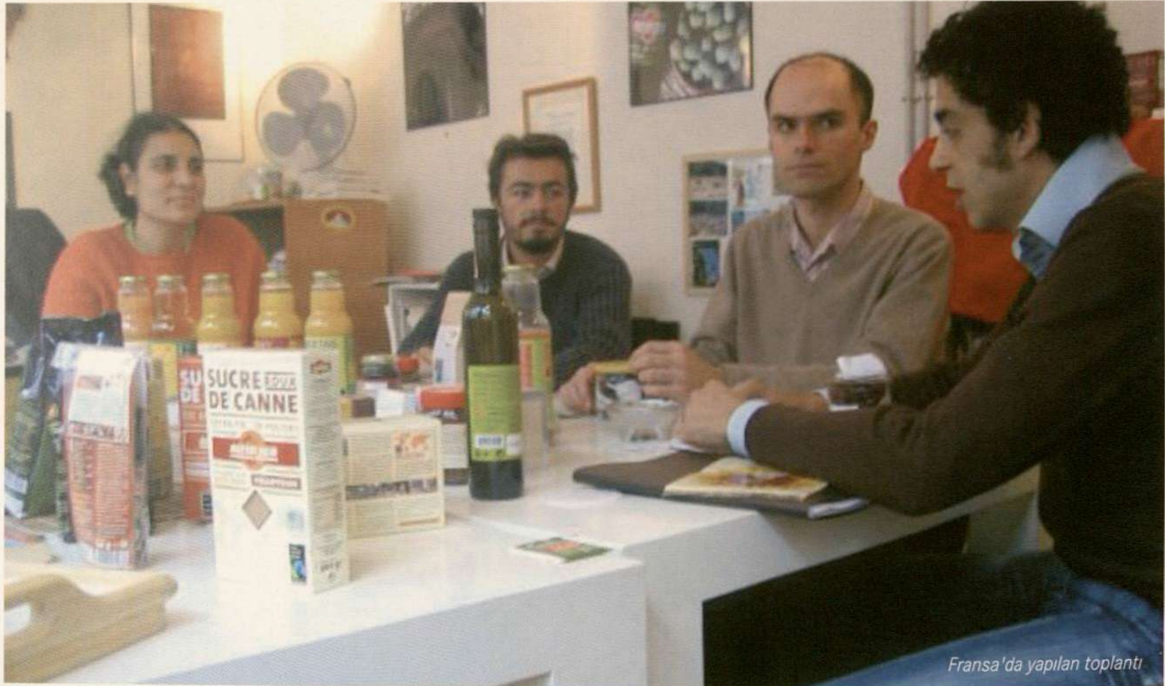
Fransa'da yapılan toplantı

Şirket adil ticaret prensibi olarak çiftçiler ile kooperatif aracılığıyla direkt çalışmayı tercih etmekte, bu suretle proje altyapı hazırlıklarını tamamladıktan sonra (kooperatif kuruluşu) çiftçiler ve Alter Eco'nun direkt bağlantıda olmalarını sağlayacaktır.