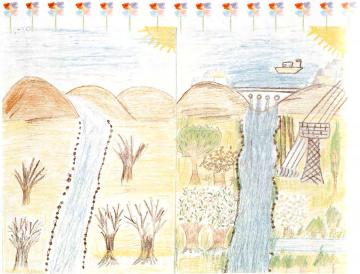
GÜLSÜN ÖRÜÇ VATAN İLKÖĞRETİM OKULU/ŞIRNAK