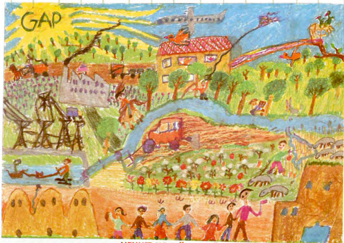
MEHMET ALP DÖNGELOĞLU VAKIFLAR İLKÖĞRETİM OKULU/ŞANLIURFA