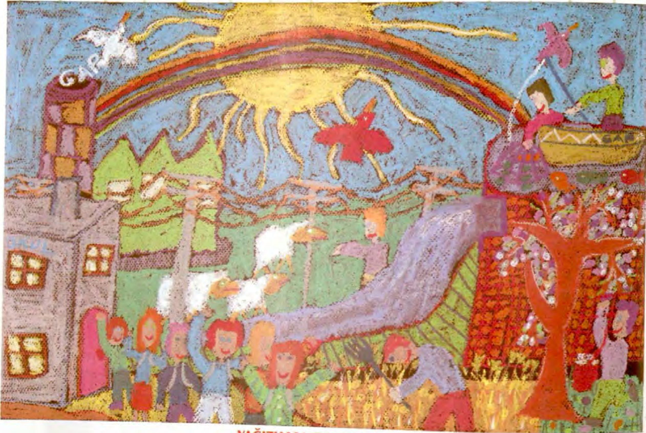
YAĞIZHAN ÇALIŞKAN MÜJGAN KARAÇALLI İLKÖĞRETİM OKULU/YENİMAHALLE-ANKARA