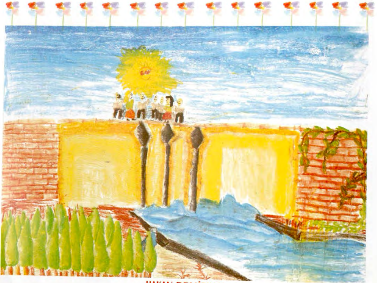
HAKAN DEMİRKAN YEŞİLDERE İLKÖĞRETİM OKULU/OĞUZELİ-GAZİANTEP