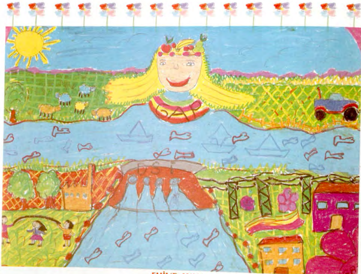
EMİNE AYAN FATİH İLKÖĞRETİM OKULU/BATMAN