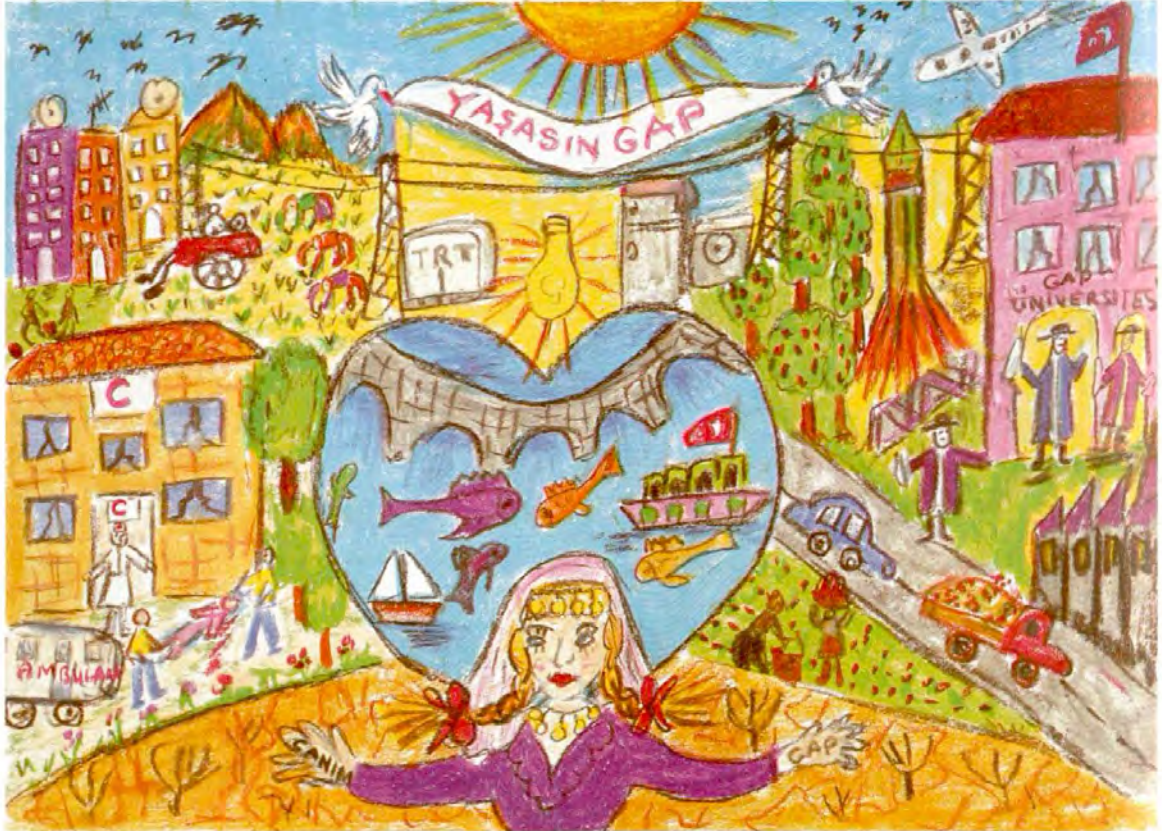
AKIN ODABAŞIOĞLU MERCİDABIK İLKÖĞRETİM OKULU/KİLİS