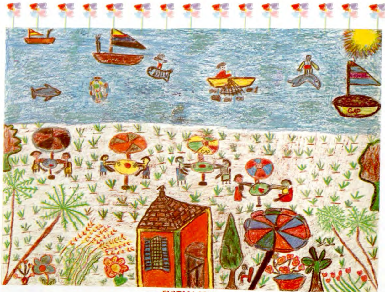
SULTAN IŞIK ŞEHİT ÜSTEĞMEN SEYHAN İLKÖĞRETİM OKULU/MARDİN