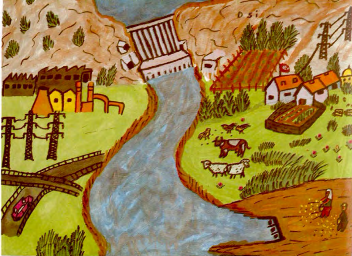
SEHER KARAKÜTÜK CUMHURİYET İLKÖĞRETİM OKULU/ADIYAMAN